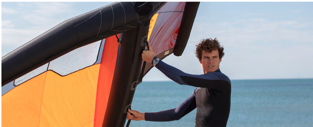
Titouan Galea, triple champion du monde de Wing Foil.